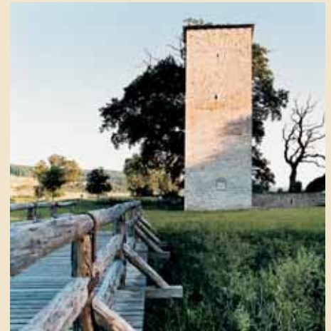
Bild 1: Hungerturm; Bild 2: Picknick am Römerkastell in Pfünz; Bild 3: Jurahaus in Inching

Genussvolle Spazierstunden sind in der Gemeinde Walting nicht nur erholsam, sondern auch unterhaltsam und lehrreich. Das zeigt etwa ein Gang auf dem Römerlehrpfad rund um das teilweise rekonstruierte Römerkastell oder auf dem von Ulmen, Pappeln und mächtigen Silberweiden gesäumten Feuchtgebietslehrpfad.